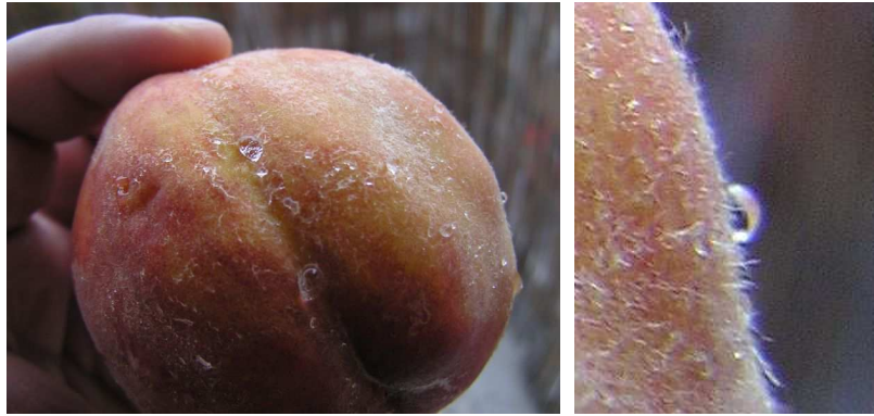
6. ábra: Vízcseppek a barackon

a lótosz levelének teljesítményétől elmarad. A barackot azért vizesre lehet mosni, ha a kezünkkel segítünk legyőzni a szőröcskéket.