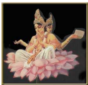
Brahma, a teremtő

Az ókori Egyiptomban a lótvuszt istenalakokkal és más szakrális jelképekkel együtt ábrázolták. A lótvuszhoz - amely a Nílus két partján virított, és így Felső Egyiptom jelképe lett - kapcsolták a termékenységget, teremtőerőt és a Napot, mint az élet és újjászületés forrását. A fennmaradt képzőművészeti ábrázolásokon vagy Hóruszt látni a lótvusz virágán, vagy Izisznek és Ozirisznek szolgált trónul.