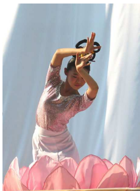
Egy új nap köszöntése