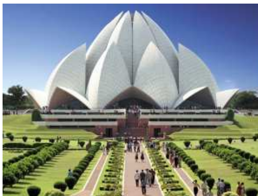
Lótusz templom, Új Delhi