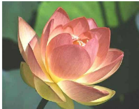
1. ábra: Indiai rózsaszínű lótosz

Nelumbo nucifera, tündérrózsafélék, Nymphaeaceae.