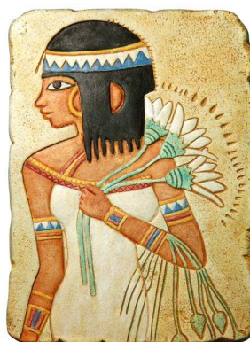
Egyiptomi lótvusz hölgy