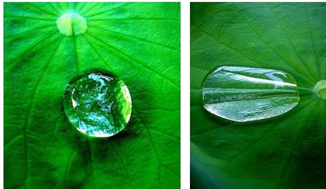
5. ábra: Tanakawho – A világ egy vízcseppben

A lótuszvirág titka az, hogy a levelek felülete erősen víztaszító (hidrofób), azaz szuperhidrofób. Egy üveglapon a vízcsepp lustán elterül, lapos dombocskát formázva. Egy víztaszító felületen a vízcsepp sokkal gömbölyűbb és ez fokozódik a lótusz levelén, ahol szinte gömb alakú. Ez látszik Tanakawho fotóján.