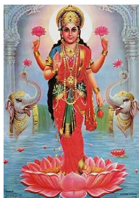
Lakshmi, a gazdagság istennője