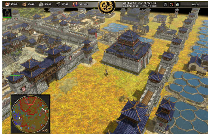
1.1. ábra. Pillanatkép a 0 A .D. játék han_china modjában a szerző (a térképen piros) által játszott egy játékmenetből.

Ezt a tézist szubjektív élményeimmel és a gyermekeimmel történt beszélgetések alapján tudom csupán megerősíteni, vagy még inkább csak illusztrálni. Például a 0 A. D. adta üres világot mindinkább megszervezni (beépíteni) személyes tapasztalatom szerint ez egy nagyon jó játékelményt adó elfoglaltság. Ennek egy pillanatfelvételt látjuk a következő ábrán.